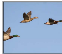
la migration automnale Page 3